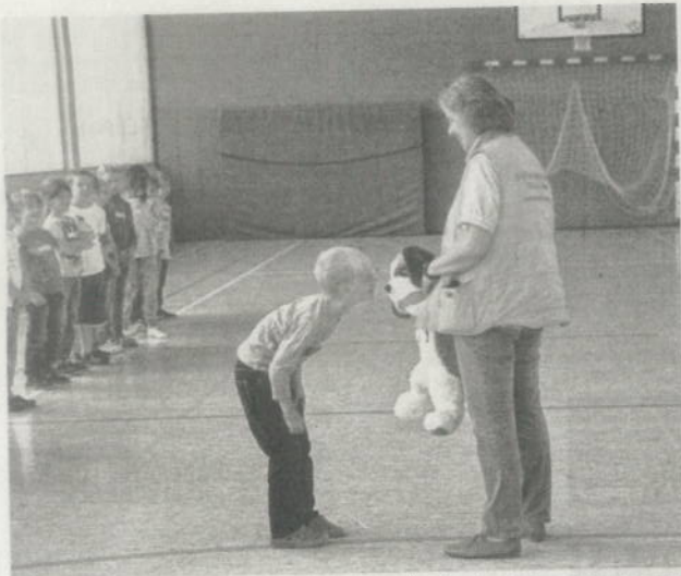
Die Kinder haben anhand von „Trockenübungen“ gelernt, wie sie sich im Umgang mit Hunden verhalten sollen.

Die Bürgerstiftung Herzogenrath bietet ein Hunde-Sicherheitstraining für Grundschüler an